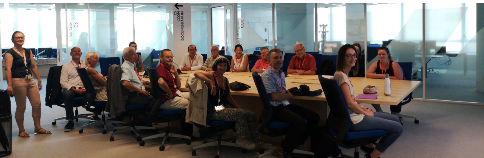
Visite du centre technique de crise de l'IRSN par le GPPA

« Ce que pourraient faire les CLI, dans le cadre d'une politique transfrontalière de décontamination, nécessitant d'entreposer des déchets nocifs et notamment radioactifs, c'est déjà d'anticiper en identifiant des zones potentielles d'entreposage où l'on sait que cela ne portera pas atteinte ni à la population, ni à l'environnement ».