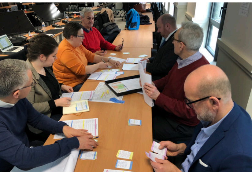
Atelier du 11 février 2020

Dans le contexte français, on constate que les populations locales sont les principales parties prenantes de la gestion de crise et du post-accident ce que soulignent les Conventions d'Aarhus et d'Espoo en reconnaissant que la participation transfrontalière de ces populations aux phases de préparation et de gestion est une condition sine qua none d'une préparation effective et efficace.