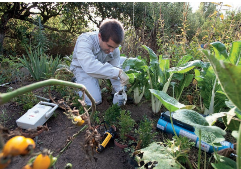
Prélèvement de terre dans un potager et mesure de la radioactivité.