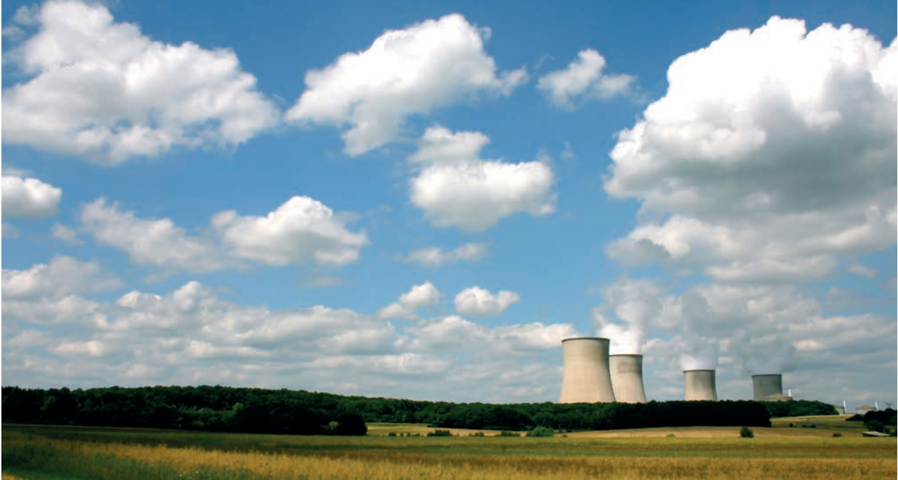
La centrale nucléaire de Cattenom.

Outre qu'elles n'ont donc en l'état pas de légitimité incontestable à intervenir dans une telle situation, les CLI ne sont pas nécessairement bien équipées pour le faire. En particulier, leur composition, adaptée à une situation de fonctionnement normal ou incidentel, n'est pas forcément bien représentative de la population dans une situation d'accident. Par exemple, elles n'intègrent pas de façon systématique de représentants de la communauté éducative ou des associations de consommateurs, pour citer deux secteurs potentiellement impactés par les conséquences d'un accident. Leur manque de représentativité peut être d'autant plus marqué lorsque les conséquences de l'accident s'étendent sur de grandes distances et touchent des populations au delà de celles que les élus locaux représentent dans la CLI. A fortiori, en cas d'évacuation dans le périmètre du Plan particulier d'intervention (PPI), les membres de la CLI ne seront plus en mesure d'assurer leur mission au sein même de ce rayon. La législation actuelle ne permettrait pas aux CLI d'intégrer de membres hors des quatre collègues réglementaires ou de leur périmètre géographique strict, alors que cet élargissement pourrait être nécessaire à une meilleure représentativité en situation accidentelle ou post-accidentelle.