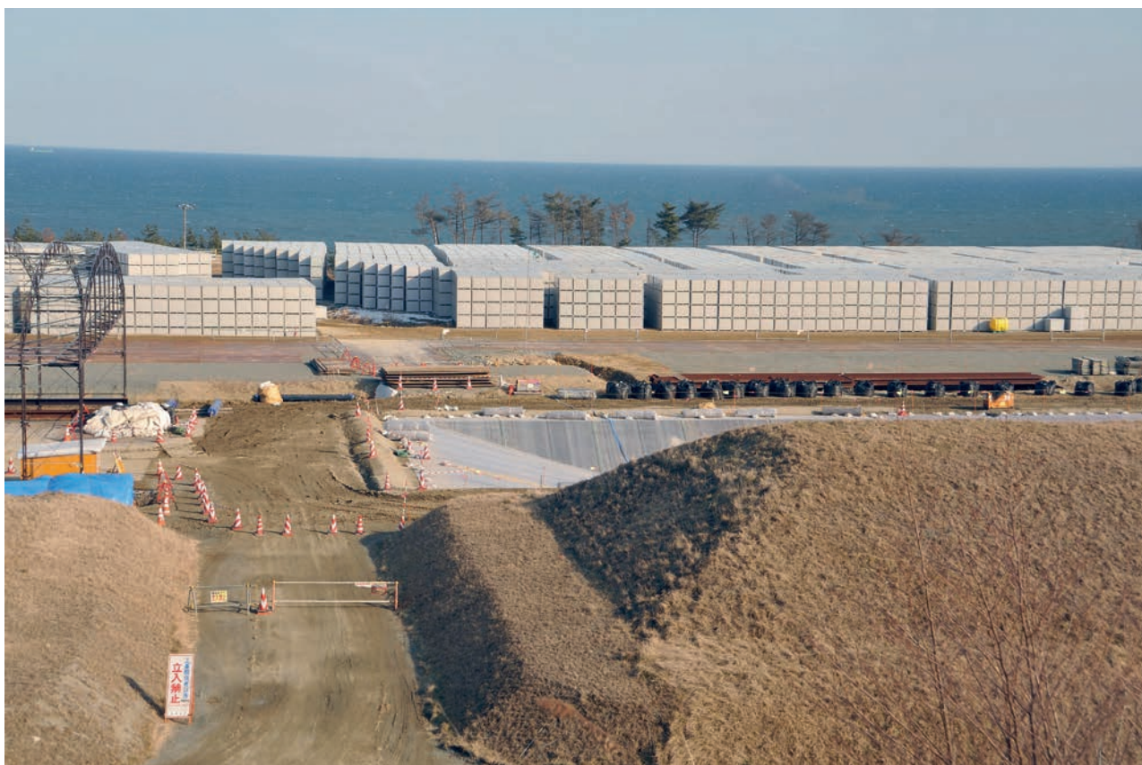
Stockage de déchets sur le site de Fukushima-Daiichi.

La CLI concernée devra être informée des décisions concernant le choix des parcelles à décontaminer afin d'être en mesure de relayer cette information aux populations concernées, avec une vision globale du plan de décontamination. Elle peut également participer à l'établissement de ce plan car elle rassemble de nombreux acteurs du territoire, ce qui lui permet d'avoir une vision d'ensemble des besoins.