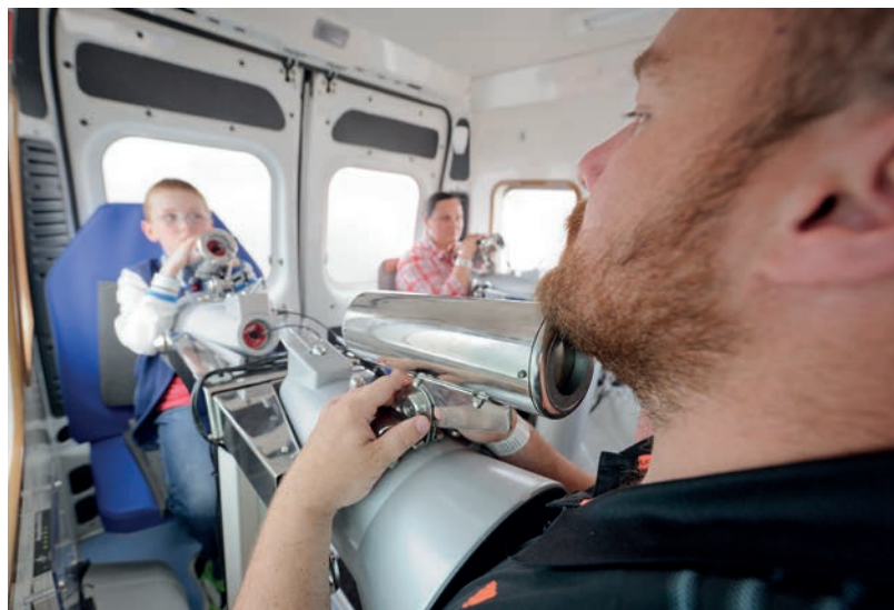
Exercice transfrontalier de gestion de crise en cas d'accident à la centrale de Cattenom : 1 - contrôle de la

L'organisation du regroupement familial, bien que le sujet soit identifié dans la fiche mesure, ne semble être définie dans aucun document faisant état des travaux réalisés autour de la gestion post-accidentelle. D'une manière plus générale, la réorganisation de la communauté délocalisée ne semble pas anticipée à moyen ou long terme. Comment maintenir le lien social entre les membres d'une communauté relocalisée ?