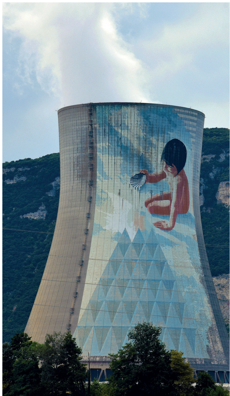
Centrale Nucléaire de Cruas-Meyssac.

Alors que le rôle des territoires et des CLI est assez limité en situation d'urgence, ils sont au cœur de la gestion post-accidentelle dès la levée de la situation d'urgence. Leur capacité à remplir leurs missions dépendra des moyens humains et financiers qui leur seront disponibles, mais également de leur capacité à avoir su en amont de l'accident se préparer et s'organiser, et sera sensible au degré de préparation et d'information préalable des populations. Pour pouvoir se préparer, les CLI ont besoin d'une définition claire de leurs missions en situation accidentelle et post-accidentelle.