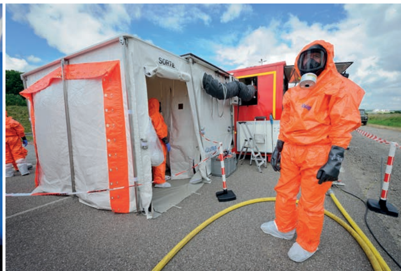
contamination interne par l'IRSN dans un véhicule mobile. 2 - Douche de décontamination sur un semi-remorque. 3 - Pompier en tenue de protection dans la zone de décontamination

Cependant, les critères sur lesquels serait basée une décision de restriction ne sont pas donnés.