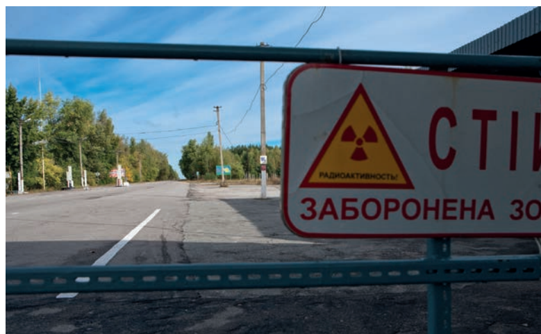
Barrière de la frontière de la zone contrôlée de Tchernobyl.

La fiche 31 du Plan national [6] indique que le SDIS/CMIR sollicité en situation d'urgence pourrait également être sollicité en sortie de phase d'urgence. D'autres intervenants, comme les services de nettoyage urbain, de gestion des espaces verts, pourraient être sollicités. Leur statut de travailleurs exposés aux rayonnements ionisants nécessiterait néanmoins un temps d'information. Le caractère obligatoire ou volontaire de ce travail pour les personnels ainsi que la question de leur droit de retrait semblent peu étudiés. A noter que le personnel du SDIS ne peut pas exercer son droit de retrait en situation d'urgence uniquement. Or, le CODIRPA définit la situation d'exposition d'urgence comme l'exposition directe aux rejets, et l'exposition aux dépôts radioactifs suite aux rejets entre dans la catégorie des situations d'exposition existante, pour lesquelles le droit de retrait est donc effectif pour le personnel du SDIS. Le GT 6 du CODIRPA souligne que la majorité des déchets contaminés ne