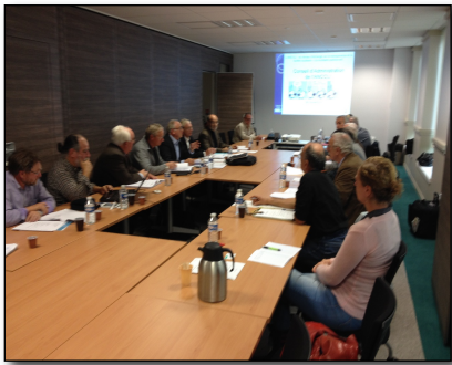
Conseil d'Administration du 04 novembre 2014

L'ANCCLI est une partie prenante sans parti pris.