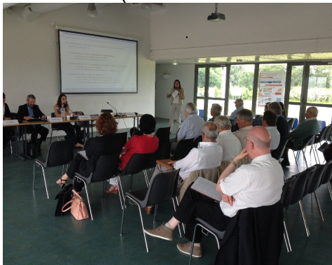
Présentation de l'outil OPAL, à la CLIn de Paluel-Penly (26 juin 2014)

Le 26 juin 2014, une présentation de l'outil a été organisée par la CLIn de Paluel-Penly, à l'attention d'élus du territoire (zone PPI et hors zone PPI).