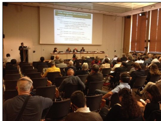
Séminaire « post-accident » - Octobre 2014