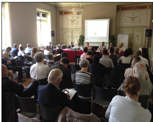
Séminaire « démantèlement » - Juin 2014