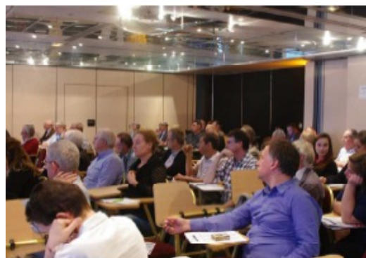
Séminaire des 29 et 30 avril 2014