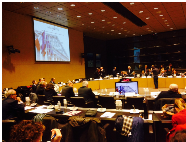
Réunion à l'OPECST – 24 novembre 2014

4) L'ANCCLI ACCENTUE SES ACTIONS AUPRES DES CLI, POUR LE DEVELOPPEMENT DE L'EXPERTISE CITOYENNE