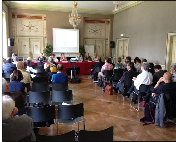
Séminaire démantèlement du 16 juin 2014

Suite au séminaire du 16 juin 2014, organisé par l'ANCCLI et l'IRSN, sur les questions de démantèlement, un vif engouement s'est fait ressentir par les membres des CLI et a conduit le Conseil d'Administration de l'ANCCLI, à mettre en place un nouveau Groupe Permanent consacré aux questions liées au démantèlement.