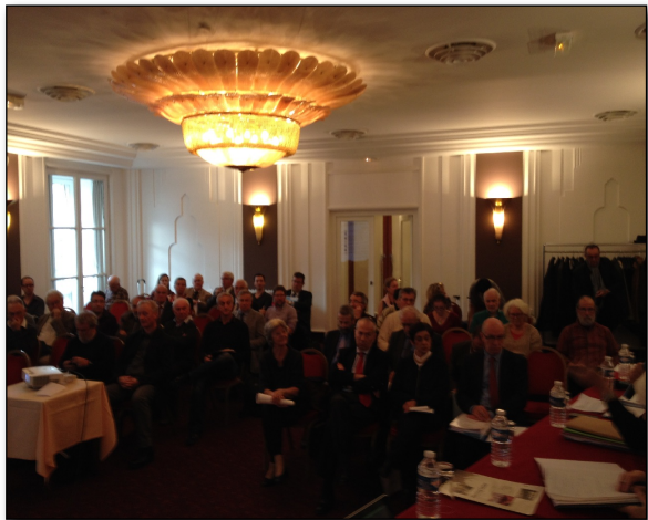
Assemblée Générale du 28 novembre 2014